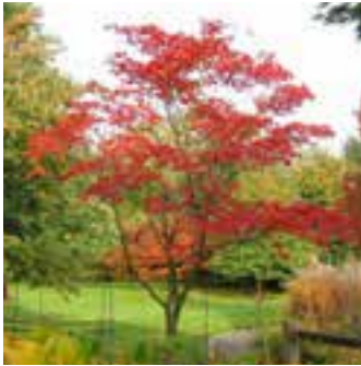
a) Japonski javor, Acer japonicum 'Acenotifolium' (3-5 m višine), na leto zraste od 25 cm v višino in 25-30 cm v širino.

Drevo pri terasi je že ostarelo in prhneče v spodnjem delu debla zaradi zatekanja vode. Te špranje bi lahko zamazali z ilovico ter ostanki vej in mu tako podaljšali življenjsko dobo. Dolgoročno je smiselno razmišljati o zamenjavi drevesa. Drevesa, primerna za ta atrij, so: