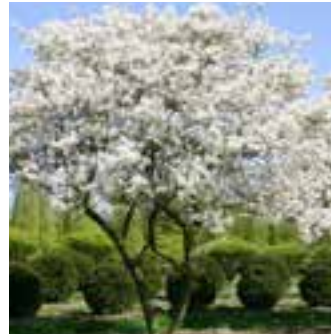
b) Šmarna hrušica, Amelanchier lamarckii (4-6 m v višino), modri plodovi, užitni, prenaša urbane razmere in veter.