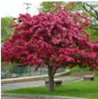
c) Okrasne jabolane, Malus floribunda (4-6 m v višino, 4-6 m v širino), hitro raste in nima plodov. Sorta 'Golden Hornet' ima plodove, ki so rumeno-zlate barve in ostanejo na jabolani tudi pozimi.